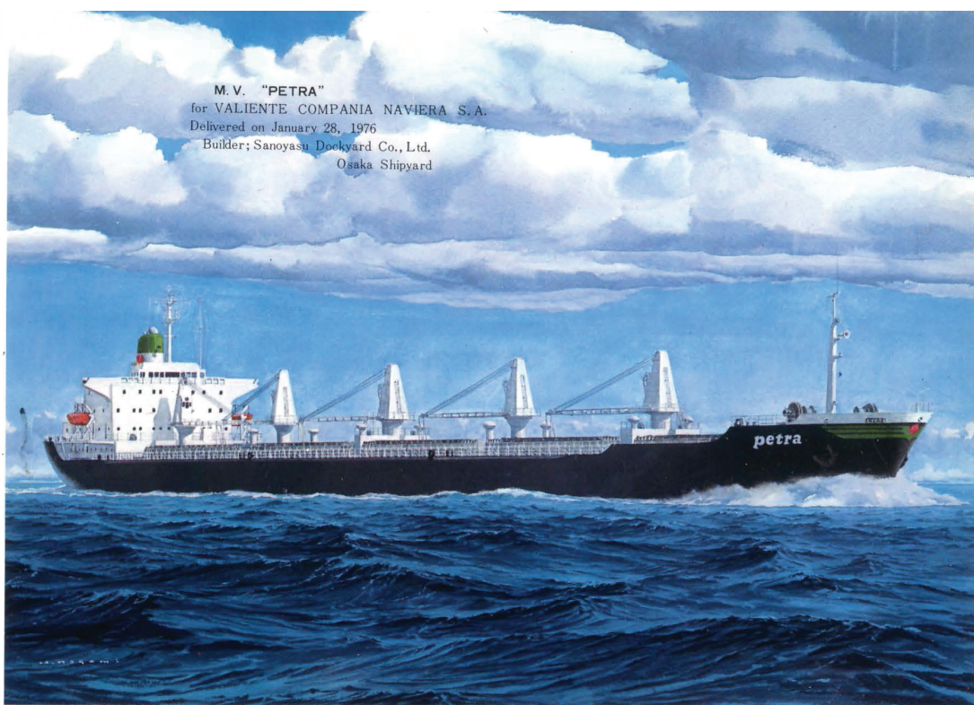
M. V. "PETRA" for VALIENTE COMPANIA NAVIERA S. A. Delivered on January 28, 1976 Builder; Sanoyasu Dockyard Co., Ltd. Osaka Shipyard