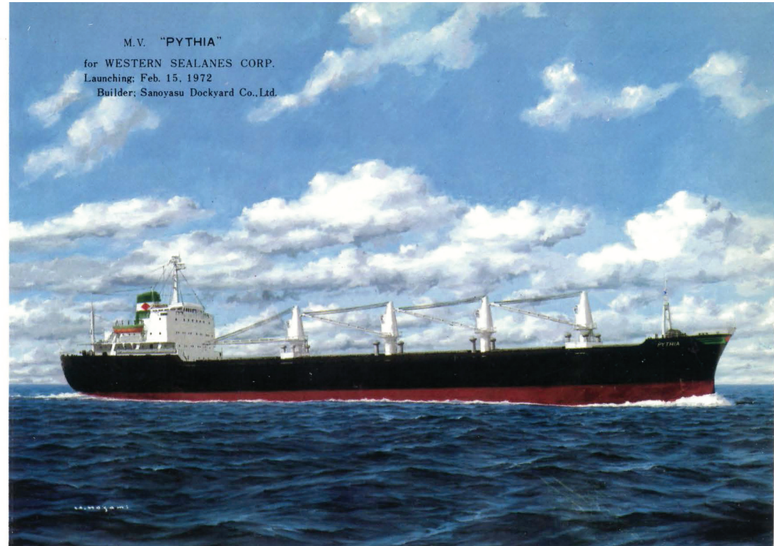
M.V. "PYTHIA" for WESTERN SEALANES CORP. Launching: Feb. 15, 1972 Builder: Sanoyasu Dockyard Co., Ltd.